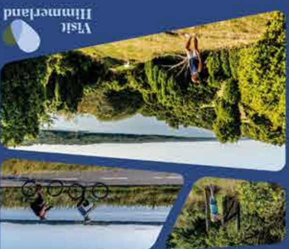
Himmerland Karte / Himmerland map

Kort med vandrer- og cykelruter, attraktioner, byer og meget mere.